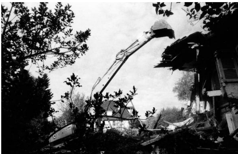
Das unrentable Gebäude fällt in sich zusammen wie ein Kartenhaus.