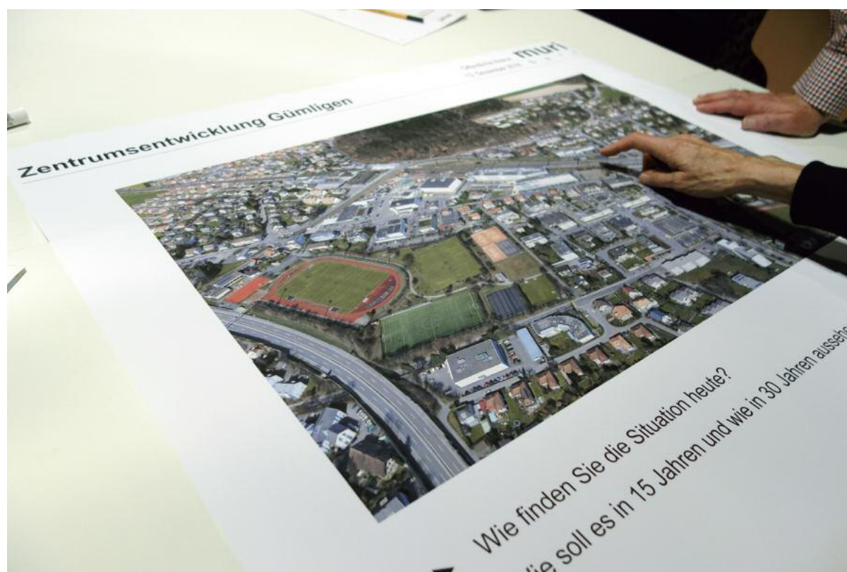
Bei der Zentrumsentwicklung in Gümligen ist die Mitwirkung der Bevölkerung erwünscht. So auch letzte Woche bei der öffentlichen Arena zum Thema Lischenmoos im Bärtschihaus.

Egal, ob einige Vorschläge für die Entwicklung des Lischenmoos-Areals völlig unrealistisch sind oder nicht. Es geht um die öffentliche Diskussion und die Möglichkeit ein solches Projekt losgelöst von Einzelinteressen aus der Vogelperspektive zu sehen und als Gesamtgemeinde voranzutreiben. In den letzten 30 Jahren wurde von dieser Art einen Ort zu entwickeln kaum Gebrauch gemacht, auch daraus resultierte das Problem der vielzitierten Zersiedelung. Löbliche Ausnahme waren zuletzt die Werkstattgespräche zum Räumlichen Leitbild der Gemeinde Muri bei Bern, die diesbezüglich eine Vorreiterrolle spielten. Dabei sind solche Verfahren eigentlich nichts Neues, bereits die Römer beschäftigten sich mit städtebaulichen Visionen im grossen Stil.