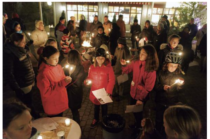
Vorweihnachtsstimmung auf der Piazza im Thoracher.