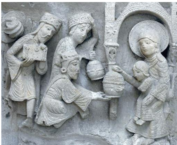
«Die Anbetung der Weisen» (ca. 1180, Autun / Burgund. Bild: ck)

Alles Gute für die kommende Zeit – Ihr Christoph Knodt