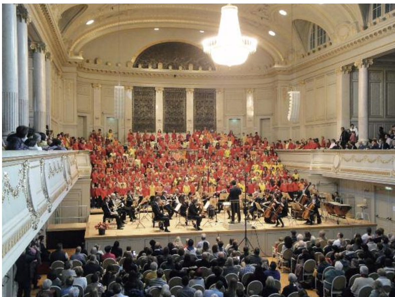
Das Konzert im Casino Bern – ein beeindruckendes Erlebnis für Alle.