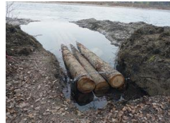
Ufersicherung im Winter 2017/2018 mittels Baumbühnen....

Am 22. April 2017 orientiert Thomas Wüthrich vom kantonalen Tiefbauamt die Bevölkerung an der Aare zur Situation. Da der Damm mit dem Aareweg in einem Auengebiet von nationaler Bedeutung liege, könne der Kanton hier keinen harten Verbau realisieren. Die Aare müsse eröffnet und der Aareweg teilweise geopfert und verlegt werden. Das Verdikt spaltet, hier der Aufschrei über den Verlust des schönen Aarewegs, dort das verklärte Bild einer neuen Auenlandschaft zwischen Muribad und Parkplatz. Es kommt zu einer