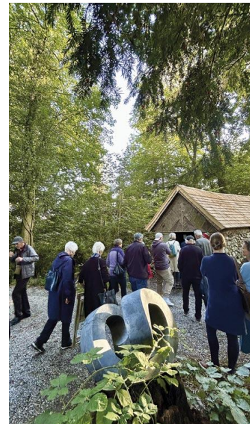
Rundgang beim Eiskeller im Mettlenpark.