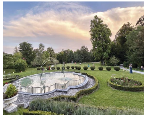
Skulpturenausstellung Kunst zum Anfassen 2025.

Kulturelle Rahmenveranstaltungen als besondere Highlights Auch die vielfältigen Rahmenveranstaltungen lockten zahlreiche Besuchende in den Skulpturenpark. «Die Reden von Frauen waren berührend und inspirierend», so eine Teilnehmerin der literarischen Rundgänge mit dem Theater Effinger. Das neue Format «Dialog im Park» bot dem Publikum die Gelegenheit, mit den Kunstschaffenden ins Gespräch zu kommen und über ihre Werke und ihr künstlerisches Schaffen zu erfahren. Am Publikumstag luden Workshops die Besuchenden ein, selbst kreativ zu werden: «Ich wollte die japanische Kintsugi-Technik schon lange einmal ausprobieren. Die Philosophie dahinter gefällt mir: Dinge zu reparieren und wiederzuverwenden. Jetzt ist