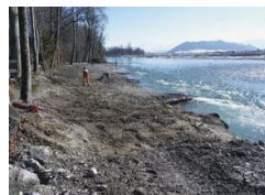
...und Weidenstecklingen.

Petition «Rettet den Aareweg und die Gonzenbachgisse» unter der Initiative von Georg von Erlach, 3'400 Unterschriften kommen zusammen. In der Folge schrieb ich Georg von Erlach in einer Nachricht, dass er allein mit dem Hinweis auf die Schönheiten des Aarewegs und der Gonzenbachgisse eine Revitalisierung im Aarwil wohl nicht werde verhindern können, dass eine solche meiner Ansicht nach jedoch die Trinkwasserfassung gefährden würde. Wir treffen uns, verstehen uns als passionierte Aareschwimmer und auch sonst auf Anhieb und planen unseren Widerstand. Anlässlich der Orientierung im Matenhof vom 26. Juni 2017, verlangen wir einen Marschhalt und eine Expertise durch einen neutralen Gutachter zur Beurteilung der Risiken für die Trinkwasserversorgung.