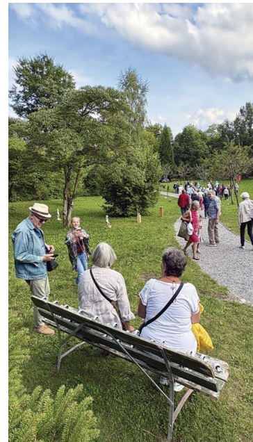
Literarischer Rundgang mit Theater Effinger.